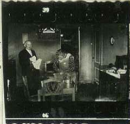
Kopie van de