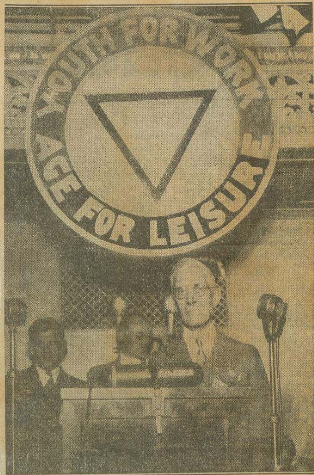
Photo shows Dr. Francis E. Townsend of California on the rostrum in Chicago at the first annual convention for followers of his $200-a-month pension plan. The convention's purpose is to perfect organization of the Townsend forces into a closely knit national body to elect congressmen who will vote for the pension plan.